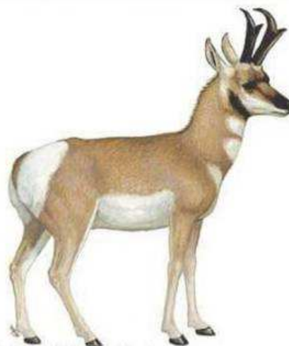
Imagen: Marco Pineda / CONABIO